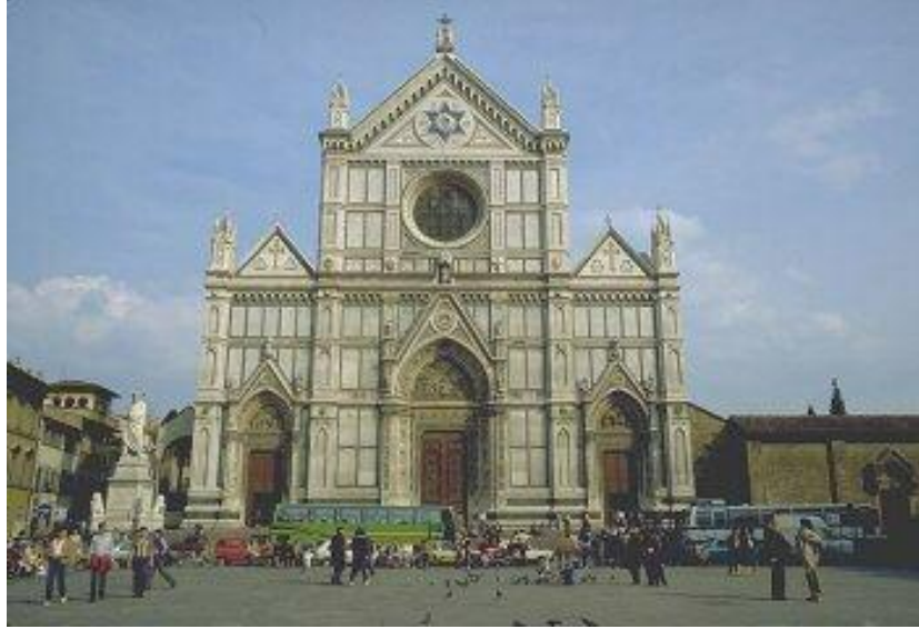
برۆنللسكی Filippo Brunellesci كلیسای سانتاگروش Sant Groce